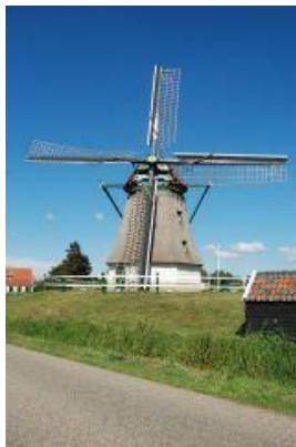
De Oude Knecht, Akersloot