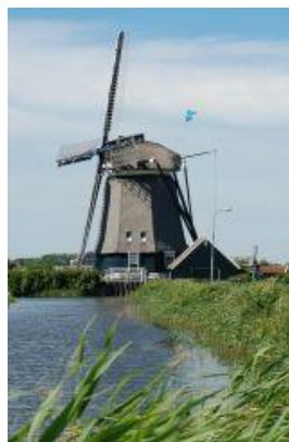
De Noorder Molen, Akersloot