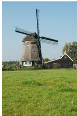
De Tweede Broeker, Uitgeest