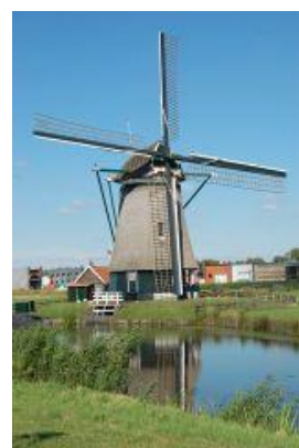
De Kat, Uitgeest