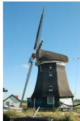
De Woudaap, Krommeniedijk