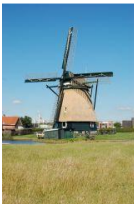
De Dog, Uitgeest

De SUAM is opgericht in 1972 en heeft het beheer over totaal 7 molens. Zes poldermolens en een korenmolen. Daarmee behoort de Stichting tot de grootste molenorganisaties in Noord-Holland.