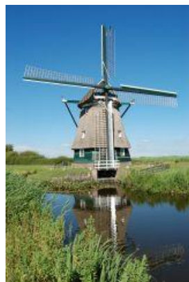
De Dorregeester, Uitgeest